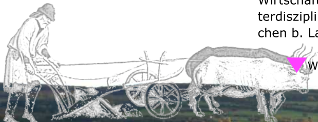
Pflügen mit dem Ochsespann um 1400 (Ausschnitt; Les Très Riches Heures du duc de Berry, Mars the Musée Condé, Chantilly)