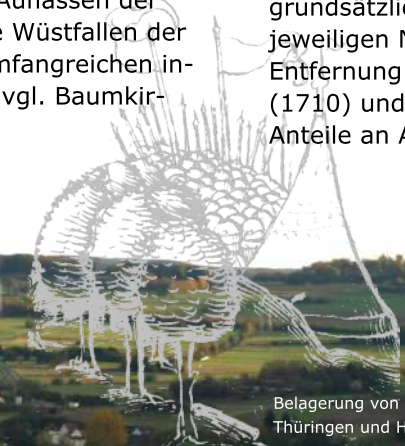
Belagerung von Staufenberg 1296 (Ausschnitt; W. Gerstenberg, Landeschronik von Thüringen und Hessen, Universitätsbibliothek Kassel, 4° Ms. Hass. 115, fol. 290v)